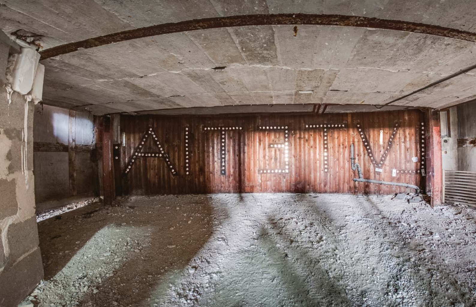
Caché derrière les lumières du Lutetia